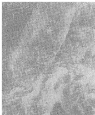
图 2 大白鼠肾上腺组织表面上的毛细血管割断前的 SEM ( 5000\times )

图 2 是大白鼠肾上腺组织及其上丰富的毛细血管。血管的外膜为含有弹性纤维的结缔组织逐渐与包裹在相邻器官外面的结缔组织相融合,未经树脂割断前,只能看到血管外壁的细微形貌。图 3 为树脂割断后血管腔内壁的细微结