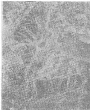
图 3 大鼠肾上腺毛细血管树脂割断后显示出血管腔内壁形貌的 SEM ( 5000\times )

构形貌。图中清晰地显示出血管内膜结构,它是由弹性蛋白质构成的小管状有孔的膜;内弹性膜呈波纹状起伏排列,图象结构层次分明,立体感强。