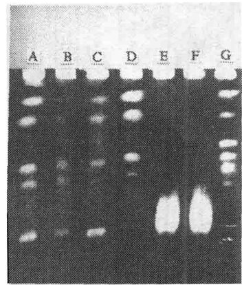
图1 不同样品的交变脉冲电场凝胶电泳结果